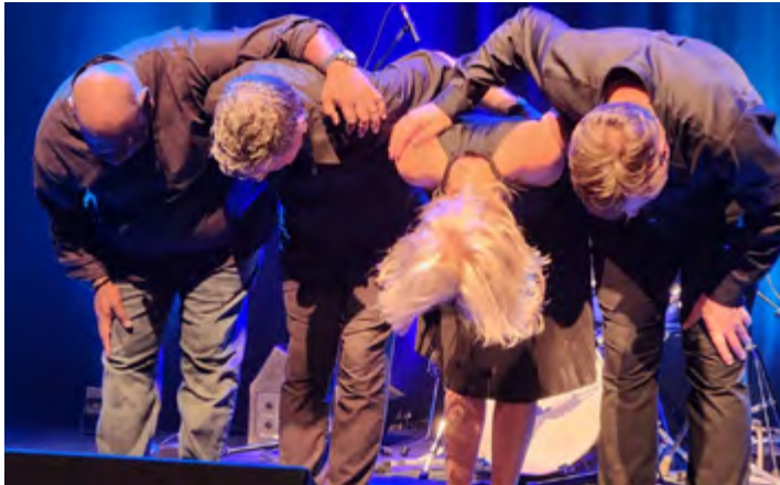
CENTRE CULTUREL DE CARAQUET, AOÛT 2025