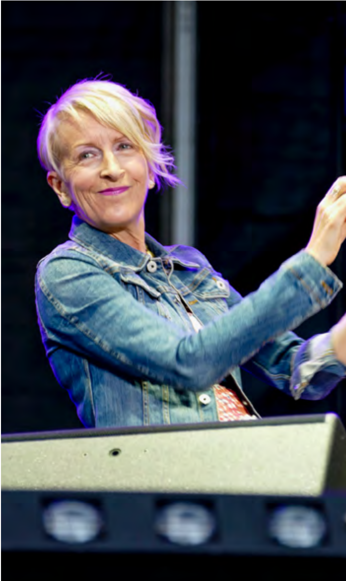
Première partie de Patrick Bruel en solo, 2018