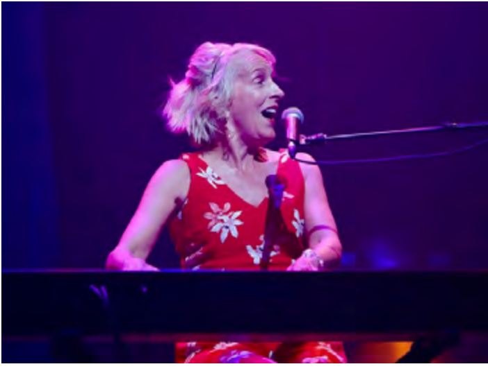
NATHALIE AU FESTIVAL DE JAZZ ET BLUES DE PETIT-ROCHER, JUILLET 2023