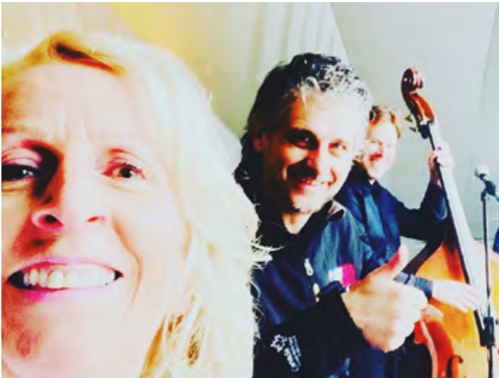
FESTIVAL DE JAZZ D'EDMUNDSTON, 2024