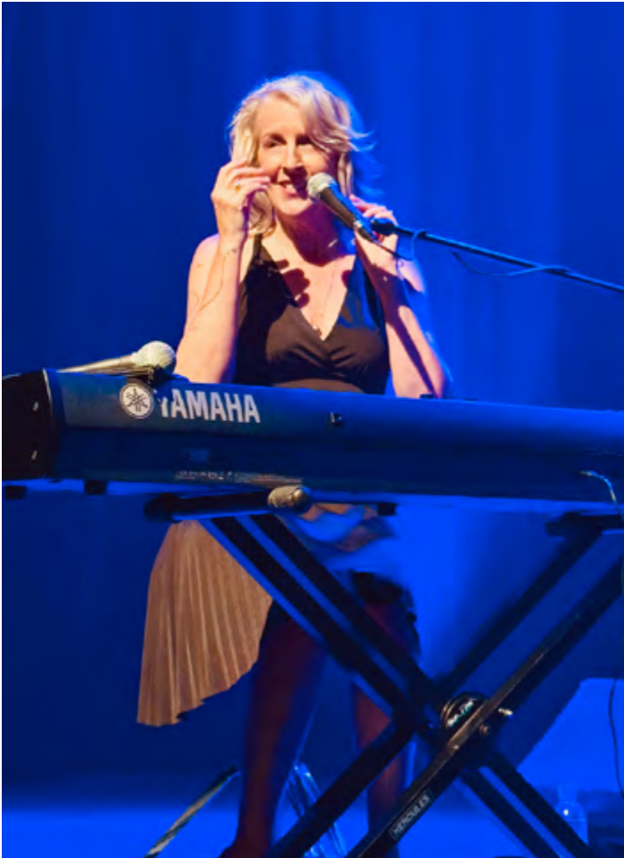
CENTRE CULTUREL DE CARAQUET, AOÛT 2025