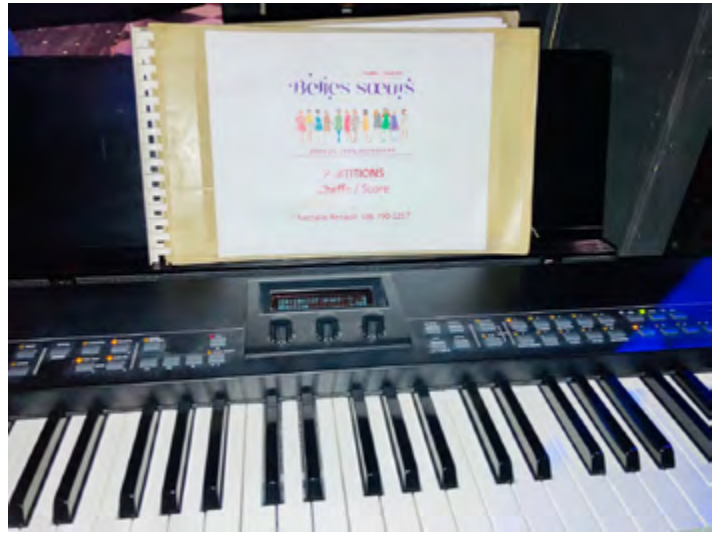
DIRECTRICE MUSICALE, RÉPÉTITION DES BELLES SOEURS DE MICHEL TREMBLAY, VERSION ACADIENNE, 2022