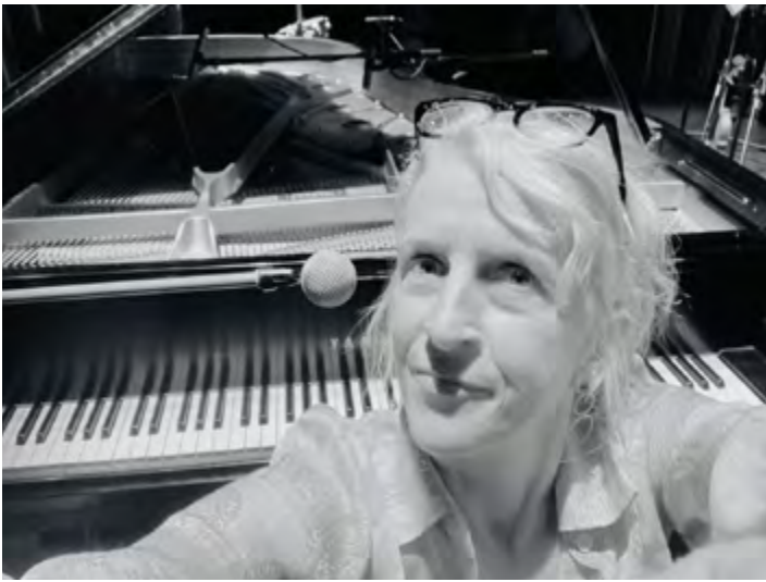
SPECTACLE EN QUARTET AU MONUMENT LEFEBVRE, NOV 2025