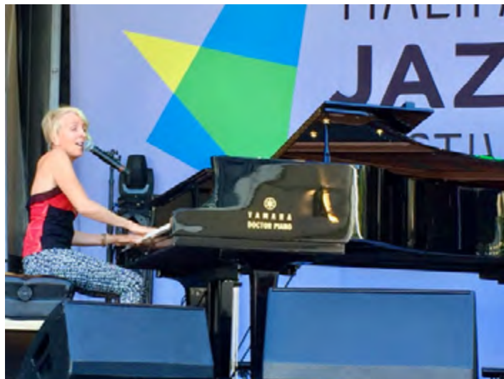
SPECTACLE « FESTIVAL INTERNATIONAL DE JAZZ DE HALIFAX, JUILLET 2021