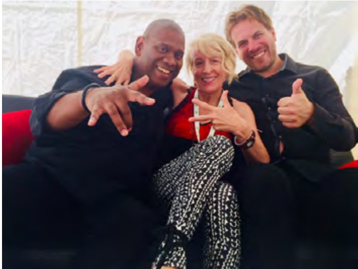
Concert «Live» présenté sur la plate-forme Facebook dans le cadre de la programmation du Centre National des Arts, 2018