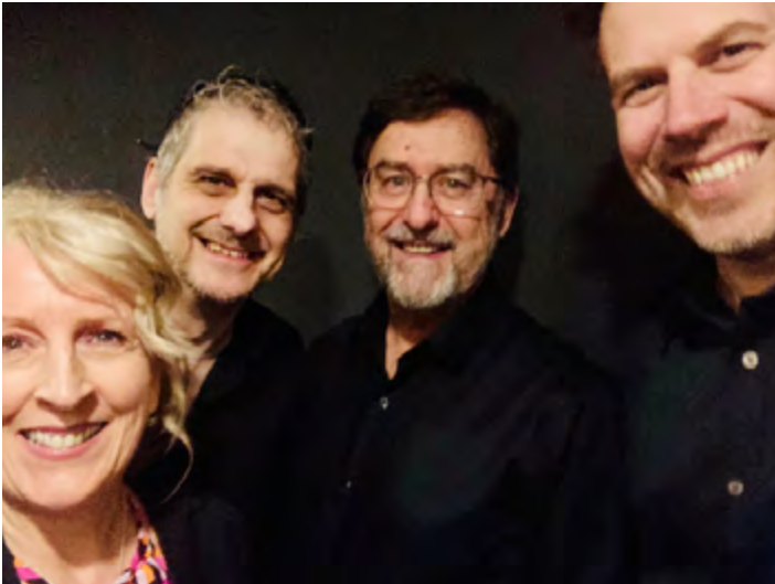
SPECTACLE DANS LE CADRE DU 50E ANNIVERSAIRE DES SOCIÉTÉS CULTURELLES DE LA BAIE DES CHALEURS, SEPTEMBRE 2022