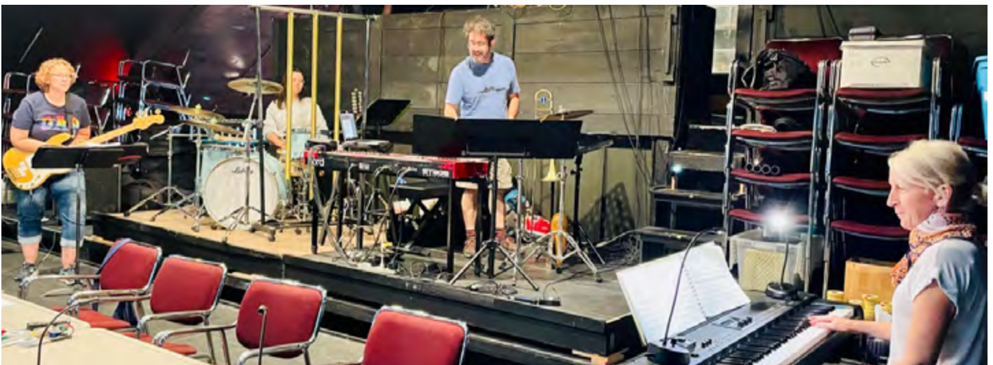
DIRECTRICE MUSICALE, RÉPÉTITION DES BELLES SOEURS DE MICHEL TREMBLAY, VERSION ACADIENNE, 2022