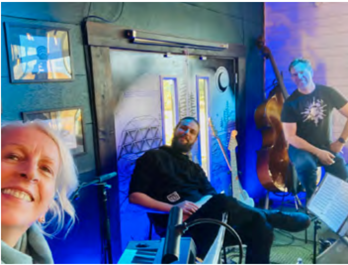
DIRECTRICE MUSICALE DANS LE CADRE DES PRIX LITTÉRAIRES ANTONINE MAILLET ACADIE-VIE, NOVEMBRE 2025