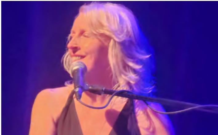
CENTRE CULTUREL DE CARAQUET, AOÛT 2025