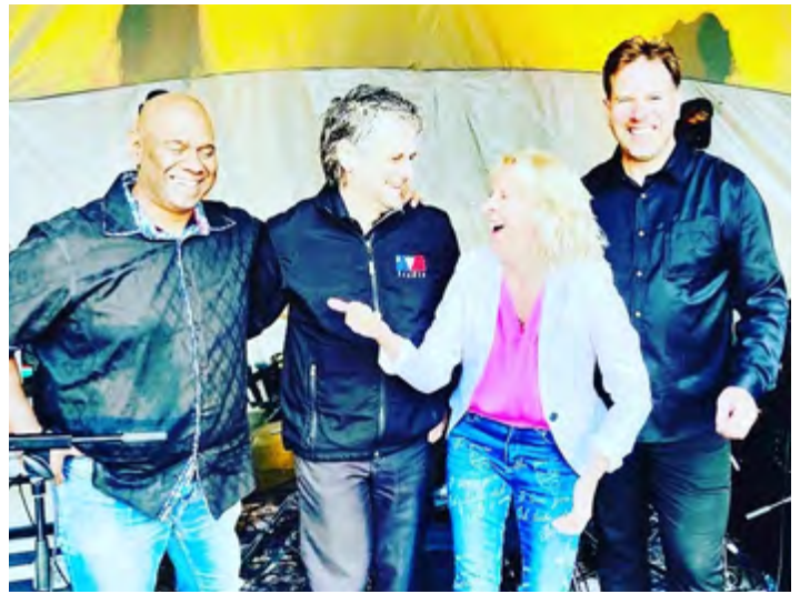
FESTIVAL DE JAZZ D'EDMUNDSTON, 2024