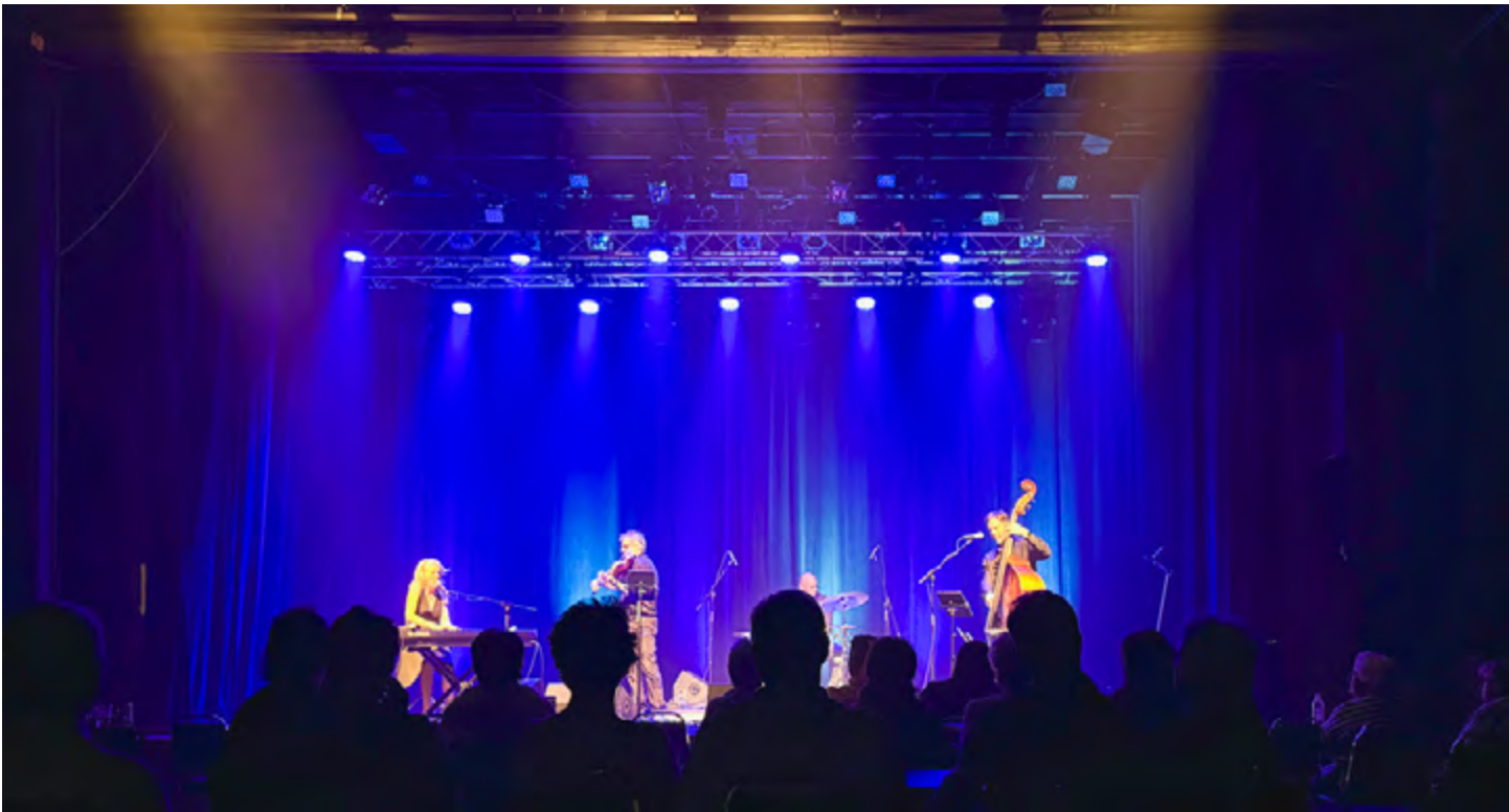
CENTRE CULTUREL DE CARAQUET, AOÛT 2025