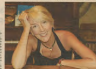
Nathalie Renault pendant des moments d'interaction et beaucoup de partage, de rit et d'échange pendant son spectacle.

« Il y aura des moments d'interaction et beaucoup de partage, de rit et d'échange. On va faire des choses que vous n'avez pas entendues, quelques nouvelles chansons et des chansons très de mon album. La chanson, à travers le chemin qui souhaite également chanter, en soirée