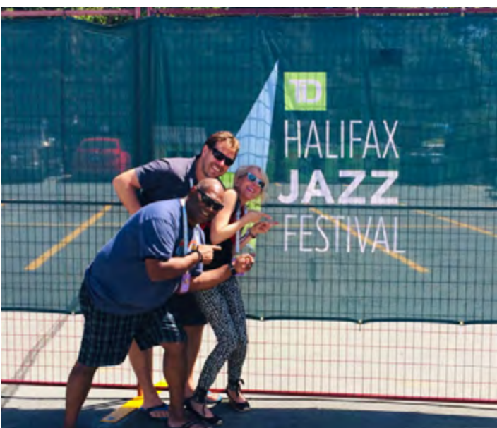
SPECTACLE « FESTIVAL INTERNATIONAL DE JAZZ DE HALIFAX, JUILLET 2021