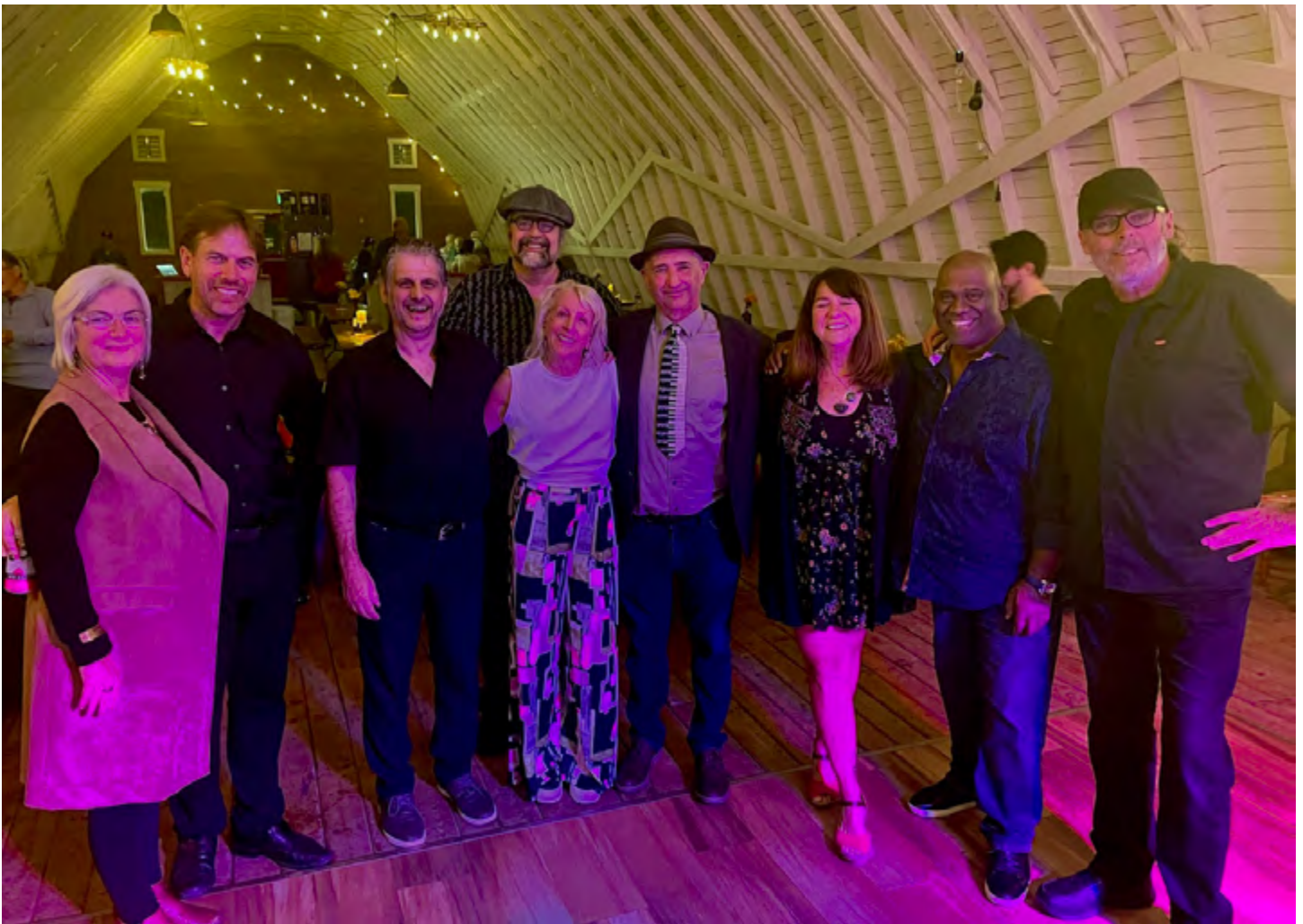
FESTIVAL DE JAZZ DE SYDNEY, NOUVELLE-ÉCOSSE, NOV. 2025