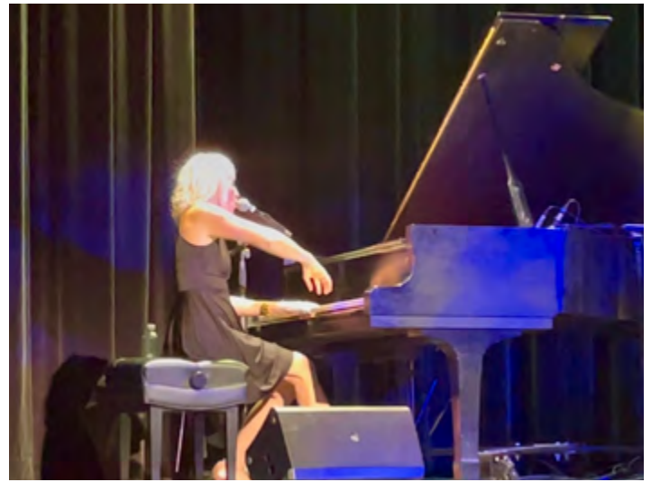
SPECTACLE EN QUARTET AU MONUMENT LEFEBVRE, NOV 2025