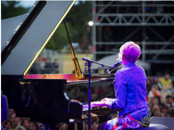
Première partie de Patrick Bruel en solo, 2018